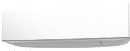
Peal white X White

Модел: RSG07KETA / RSG09KETA / RSG12KETA / RSG14KETA RSG07KETA-B / RSG09KETA-B / RSG12KETA-B / RSG14KETA-B