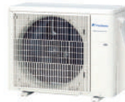
за RSG07/09/12 KETA ROG 07/09/12 KETA-B