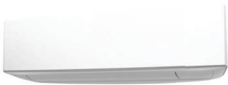
Peal white X White

Модел: RSG07KETA / RSG09KETA / RSG12KETA / RSG14KETA RSG07KETA-B / RSG09KETA-B / RSG12KETA-B / RSG14KETA-B