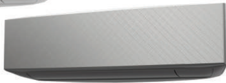
Silver X Dark gray