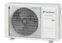
за RSG14 KETA ROG 14KETA-B