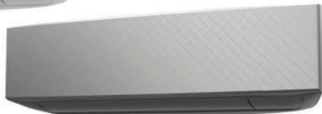
Silver X Dark gray